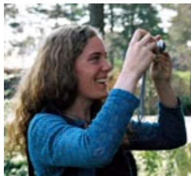
Tekst og foto: Mari Blokhus Utgiver: Jenter i Skogbruket 2005

Kanskje vekkes din skoginteresse når du leser heftet...?